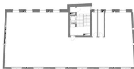
Grundriss, 2. Obergeschoss