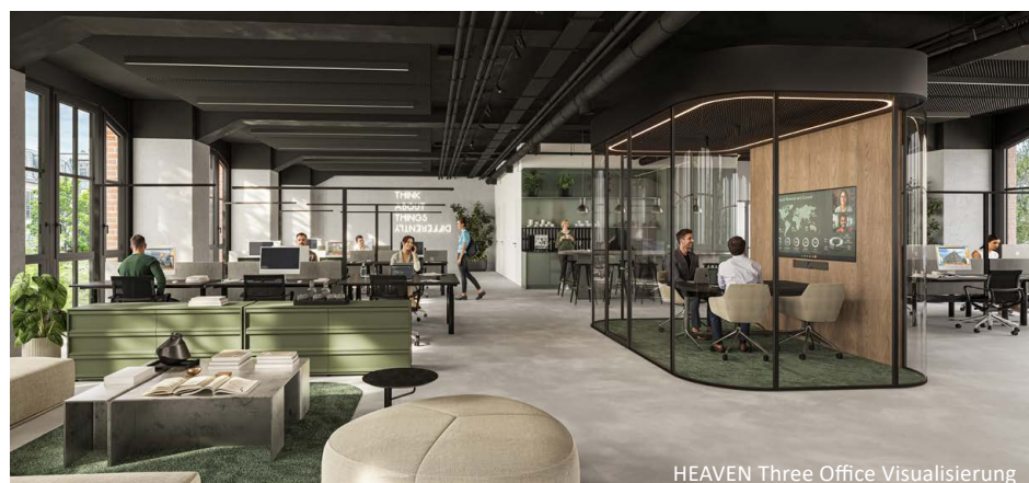
HEAVEN Three Office Visualisierung