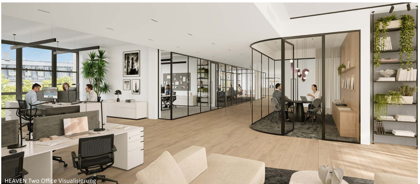
HEAVEN Two Office Visualisierung